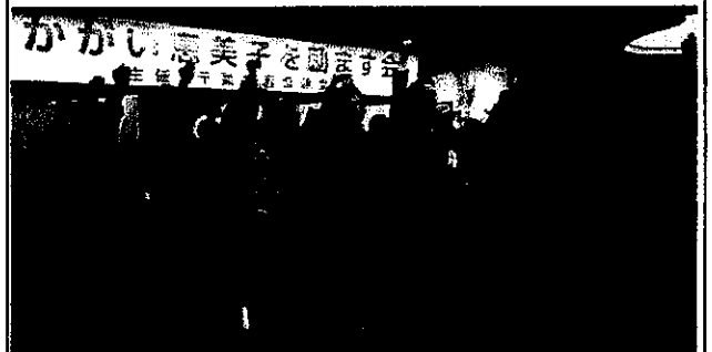
平成28年自由民主党埼玉県支部連合会女性部「総会・新年懇親会」

今月 21 日の千葉県を皮切りに、夏の参議院選挙に向けた各都道府県での決起大会が始まりました。選挙までの限られた日数ではありますが 47 都道府県すべてを訪問し、顔の見える関係を築いていきたいと考えております。皆様のご支援、ご協力をよろしくお願いいたします。